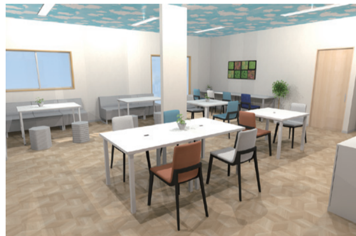
提案時の 3D パース