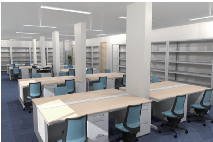
提案時の 3D パース