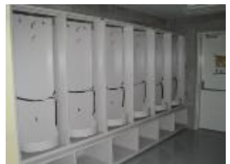
回転式防火衣収納棚