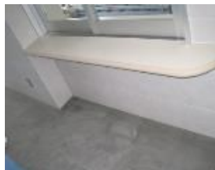
事務室カウンター